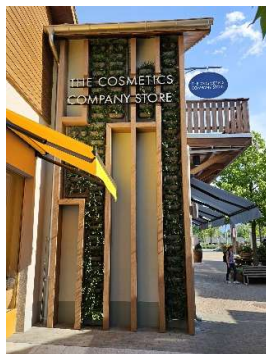
Wandgebundene Begrünung Landquart Fashion Outlet, 2023